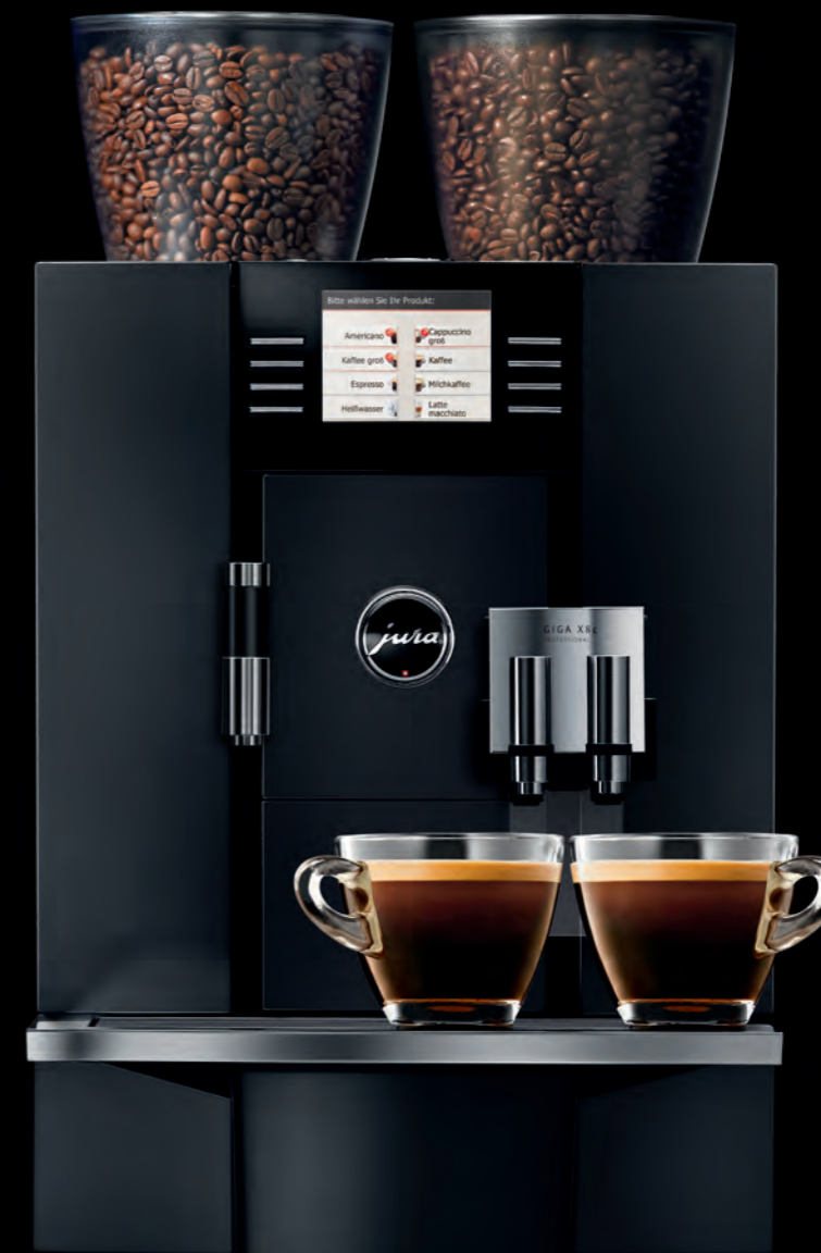
GIGA X8c Professional

GIGA-Kunden kommen in den Genuss eines exklusiven, neuen Servicekonzepts, das dem hohen Qualitätsstandard von JURA vortrefflich gerecht wird. Das »Rundum-Service-Paket« stellt die Leistungsfähigkeit der professionellen Vollautomaten sicher und dient deren Werterhalt, 25 Monate oder 45.000 Zubereitungen lang. Dies beinhaltet z.B. zwei Inspektionen nach 9 und nach 18 Monaten.